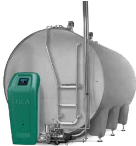
Tanksteuerung GEA ICool

Mit der Plusbox hat GEA nun ein energieeffizientes Kälteaggregat für die Milcherzeugung im Angebot, das sich in anderen Bereichen der GEA Welt bereits bewährt hat. Nun kann sie auch in die GEA Kühltanks TCool, VCool sowie die Tanks anderer Anbieter integriert werden. Der besondere Vorteil: Dank Frequenzregelung passt sich die Kühlkapazität dem jeweiligen Kühlbedarf an. Dadurch ist die kompakte Plusbox vor allem für geringen Milchfluss beim automatischen Melken geeignet. Und das alles unter Aufwendung vergleichsweise geringer Energiemengen. Abgerundet wird ihr Leistungsspektrum durch eine besonders gute Dämmung, die für einen geräuscharmen Betrieb sorgt. Das schont einerseits die geräuschempfindlichen Ohren der Tiere und stört andererseits nicht die Ruhe der Nachbarn.