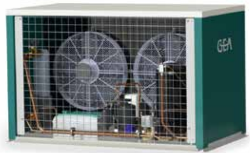
Sofortkühlösung DairyCool C5430

Der neue modulare Chiller DairyCool C5430 von GEA ist eine Sofortkühlung, die im Stand-alone-Betrieb arbeitet oder als zusätzliche Kühlleistungsquelle eingesetzt werden kann. Sie wird direkt vor dem Tank installiert und sorgt dort stets für kühl temperierte Milch. Speziell für Milchbetriebe entwickelt, ist der Chiller in kleinen Leistungsgrößen erhältlich. Dadurch dass er modular installiert werden kann, ist er für alle Betriebsgrößen nutzbar. Je nach Bedarf können pro Steuerung bis zu sechs Module betrieben werden. Dies macht ihn zum echten Effizienzwunder im Stall, das obendrein mit den Ansprüchen wächst.