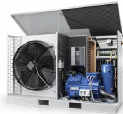
Kälteaggregat GEA Plusbox

Schuler Landtechnik GmbH & Co. KG 79274 St. Märgen www.schuler-landtechnik.de