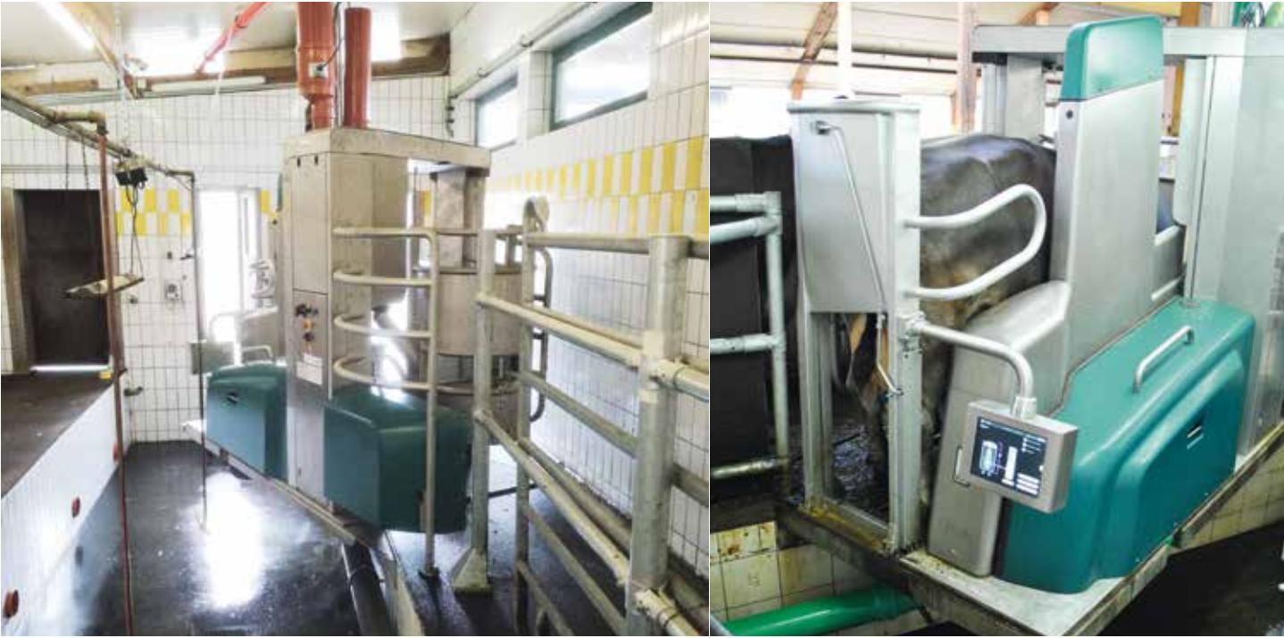
Dairy Robot R9500 als Podest-Lösung im bestehenden Melkstand

Die Kuhherde gesund zu halten, wird dadurch wesentlich einfacher! All diese Faktoren zusammen tragen wiederum zu einer höheren Betriebseffizienz bei. Dazu kommt, dass der GEA DairyRobot R9500 dank seiner Flexibilität optimal in bestehende Stallstrukturen integriert werden kann. So werden weitere Kosten eingespart, die früher noch für den Bau eines neuen Stalls oder einen Umbau angefallen wären.